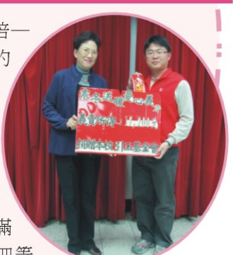
▲義賣所得捐贈引玉基金會

校長表示，為了這次義賣活動，全校師生總動員，希望藉此活動，宣導愛物惜物的觀念，啟發同學對於弱勢群體的關懷，從具體行動中感受付出與惜福的快樂，所以此次活動深具教育意義。