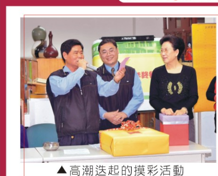
▲高潮迭起的摸彩活動

本校於1月20日假學校圖書館第一閱覽室舉辦「教職員工年終餐會暨賀歲摸彩活動」。餐會準時於中午12時展開，校長與校務主任於會中代表學校表達由衷感謝大明全體同仁過去一年的辛勤付出，使得學校校務得以順利推展。餐會過程中熱鬧的氣氛洋溢，加上豐富的摸彩獎品，使整個活動高潮迭起，會後每位同仁抱著獎品，開懷不已。