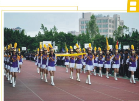
▲儀隊護送大會旗進場