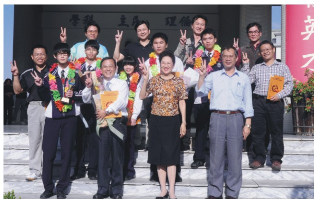
▲參加99年全國技藝競賽工業類得獎師生與校長及主任合影