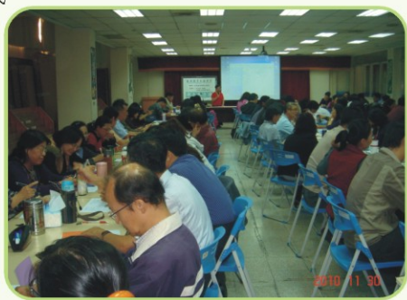
▲99學年度上學期輔導知能研習

整個專題演講環扣住生命教育的核心，從影片、實務經驗、生命典範人物故事等方式介紹生命教育的內涵與實施方式，參與的老師會後表示在實務方面有實際助益，不僅體認到生命教育的重要性，也瞭解如何實施。