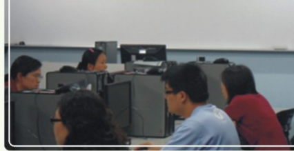
▲TQC讓大明高中職員資訊能力更上層樓