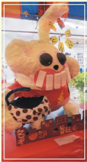
▲榮獲第二名作品(嬉遊)

此次比賽作品來自全國，競爭非常激烈，本校參加同學，在柯燈杰、張志華兩位老師指導下，作品巧心別具，結合新穎與創意，發揮天馬行空的想像力，作品不僅表現突出，更展現旺盛的生命力。其中「嬉遊」不但造型亮麗，並且把兔年的精神，表現淋漓盡致，獲評審的青睞，榮獲第二名。此次比賽成果，充份展現本校同學堅強的美術實力，值得喝采。