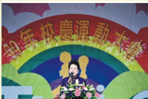
▲校長主持運動會開幕式