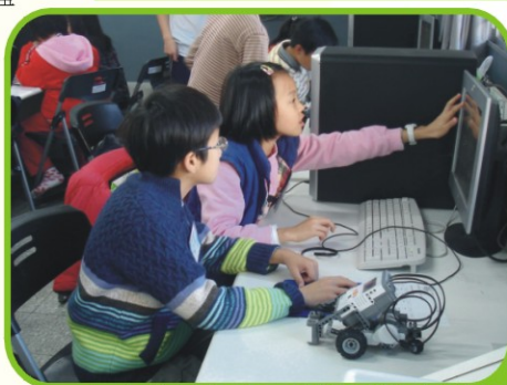
▲共同研究，我的機器人最棒