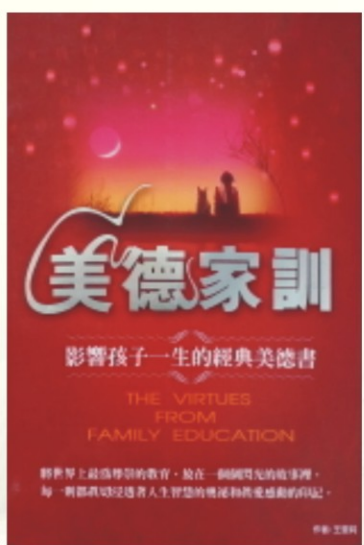
▲董事長贈送的好書之一

「美德家訓」精選的故事與題材生動感人，引導孩子在閱讀中思考，在思考中感受到智慧的火花與人生的樂趣，尤其是涉世未深的青少年，非常適合閱讀；除此之外，在競爭的社會中，第二語言能力培養，更不容忽視，自由運用所學，是語言學習的最終目標。本校英文課程設計亦是秉持相同的理念，希望同學除了學校課程，更透過書本培養自主學習的習慣，進而不斷提升英文能力，相信這兩本書必定能為同學帶來更為美好的明天。