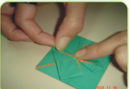
▲生命教育活動-愛心花摺紙練習