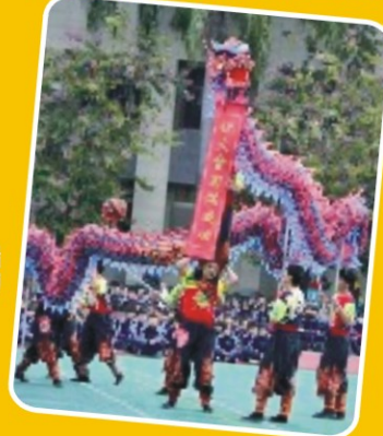
▲祥龍獻瑞大會成功