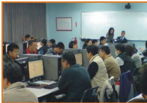
▲參與熱烈 收穫滿滿

創作令人驚豔的Flash 動畫與網站可以很簡單！本次活動大家熱烈參與，活動中大家將平常的照片、影片、愛聽的音樂……等經過設計後，創作出了不一樣的感覺，更加生動及活潑，像是驚人的多媒體電影，成果收穫滿滿。