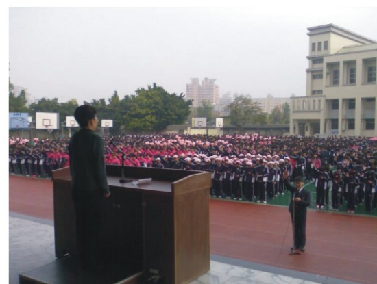
▲學生大隊長帶領同學反霸凌宣誓

校長續在校務會議中指示，應持續推動相關反霸凌議題融入教學課程及學校活動當中，讓全體學生能夠在安全無虞的環境中學習。