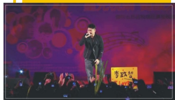
▲歌手李玖哲將演唱會帶至最高潮

大明高中創校46年校慶系列活動，在全校師生熱情參與下圓滿完成，整個活動過程展現出大明高中優良的校風，那就是「熱情生活、優質學習」。