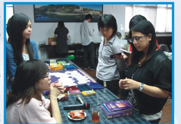
▲99學年度上學期認輔教師研習

這個輕鬆卻又能增進專業知能的研習，讓大家都意猶未盡，彷彿也經歷了一場心靈的洗禮。