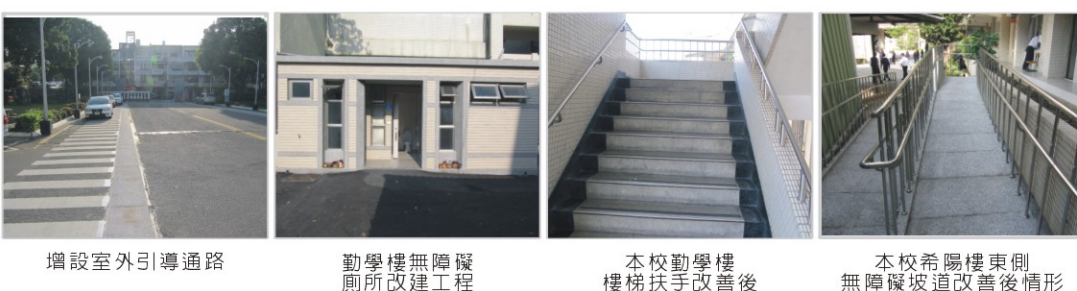
增設室外引導通路

為改善本校無障礙校園環境，本校於99年度進行以下4項改善工程，且均已完工驗收完畢。改善項目如下：增設室外引導通路、勤學樓無障礙廁所改建工程、勤學樓與希陽樓等大樓樓梯扶手、希陽樓東側無障礙坡道改建。