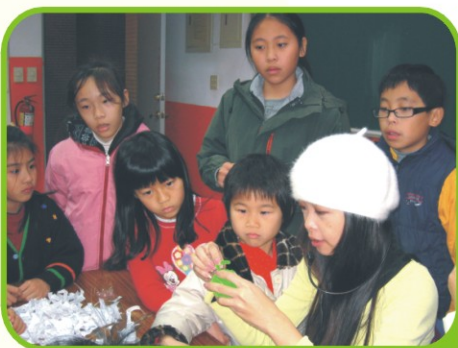
▲創意造型-好cute的毛根筆

100學年度開始，本校親子學苑為啟發孩子多元智能，體驗學習的樂趣，課程將走進社區。本期親子學苑「春季班」規劃兒童書法班、親子繪畫班、黏土創作班、兒童創意繪畫班、樂高機器人B班、樂高機器人A班、智高機器人等才藝課程，讓孩子在專業老師引導下，多元的學習並培養孩子智能，藉以增加孩子未來的競爭力！大明高中親子藝術學苑，歡迎父母親帶著寶貝，一起享受藝術創造的樂趣！報名專線：(04)24821027轉300、301、302