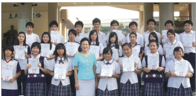
▲本校愛心志工服務隊同學與校長合影。

本年度將繼續此項計畫，配合同學們週六早上輔導課，也讓同學們能參與社會服務關懷社區，時間改為每個月的單週週日早上09:00至下午02:00，由於階段性的任務已完成，接下來，將至潭子鄉僑忠國小，進行「假日快樂營活動」。希望同學們參加志工服務隊，除了幫助這些弱勢家庭的學生外，也可以培養青年學生關懷社區、幫助別人，感恩惜福之胸懷。