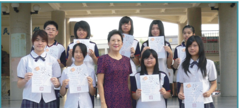
9804梯次「全國高級中等學校讀書心得寫作比賽」榮獲第一名的同學與校長合影