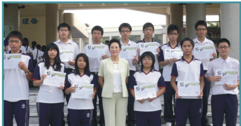
980331梯次「全國高級中等學校小論文比賽」榮獲優勝同學與校長合影

9804梯次「全國高級中等學校跨校網路讀書會閱讀心得寫作比賽」，本校榮獲第一名9位、第二名23位、第三名28位、入選53位，合計有113位同學獲獎，本校獲獎人數逐年增加，成果豐碩，足以印證推動同學們自學能力的培訓獲得顯著成效，為此圖書館將鼓勵同學們繼續參加此項有意義的競賽，以提昇同學們的自學能力。獲獎名單如下：