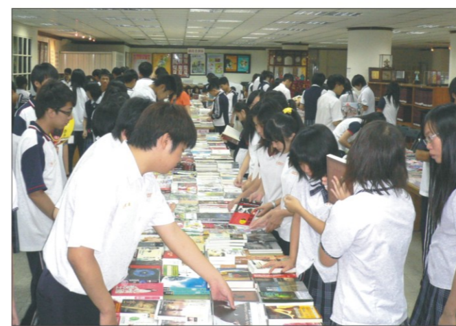
▲「悅讀風景大型校園書展」同學踴躍參觀現場情形

本次「悅讀風景：書展巡禮」活動，由金石堂廣場文化事業社承辦，書展內容包括行政院文化建委會推薦優良高中課外讀物及青少年勵志叢書，計有兩千多種圖書參展。書展期間為保持閱讀的品質，每節課以三個班級為限，此次總計有七千多人次至圖書館參觀選購，各班在任課老師的帶領下，均能保持安靜參觀選購，也獲得展覽廠商一致的肯定讚許，由於在全體師生的配合，此次的書展活動圓滿完成。