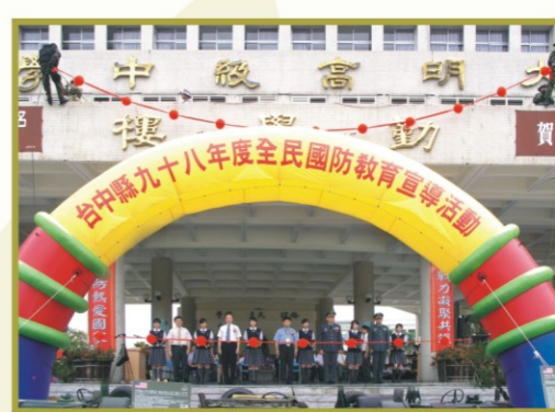
▲與軍武有約-開幕剪綵

各級學校接獲國防特展訊息，也紛紛預約參觀時間。台中縣政府暨大明高中誠摯邀請各機關、學校、團體及軍武同好，共享充滿知性與感性的軍事饗宴，並藉以建立全民國防共識，培育宏觀國際視野。