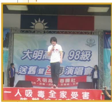
▲ 98級送舊反毒演唱會