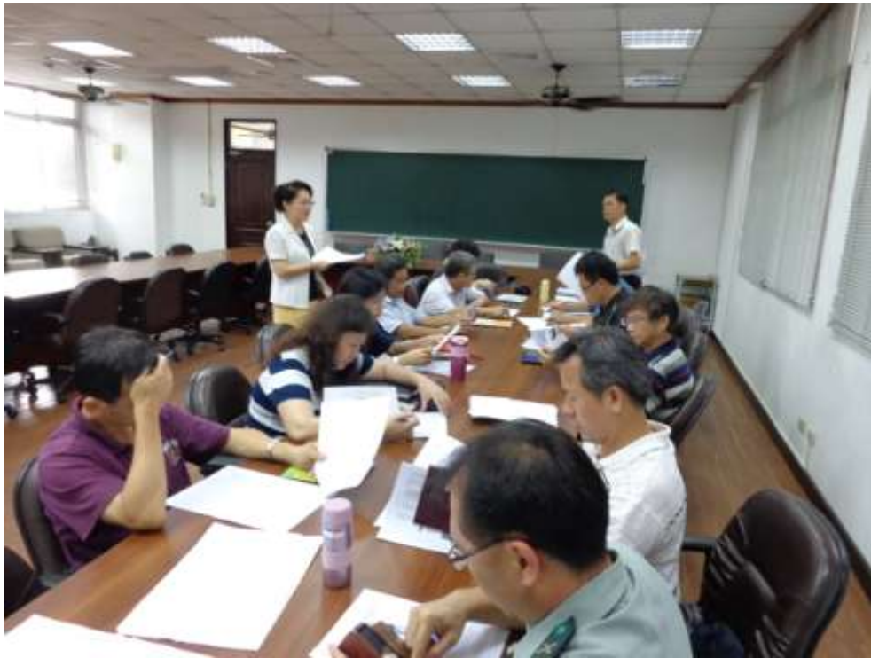
主題：課程發展委員會會議活動照片