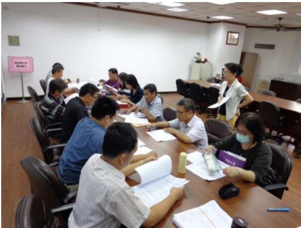
主題：課程發展委員會會議活動照片