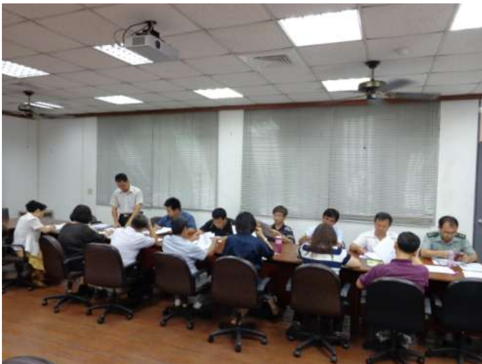
主題：課程發展委員會會議活動照片