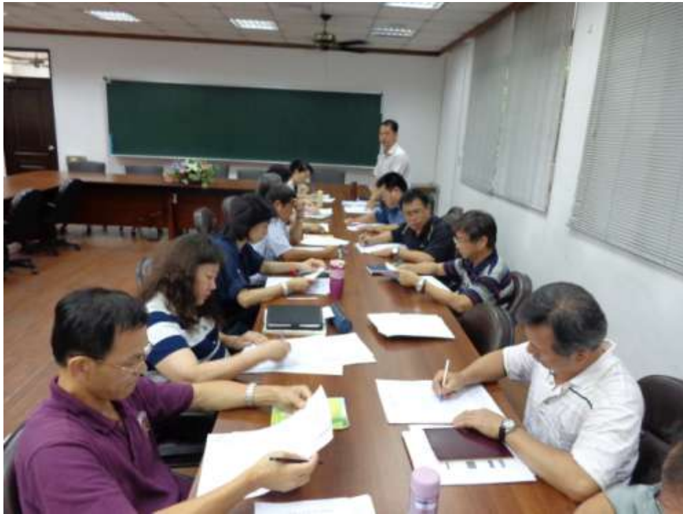
主題：課程發展委員會會議活動照片